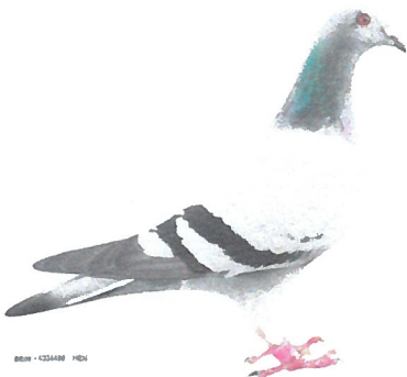
I HAVE A DREAM' 1e International Barcelona 2013 hens